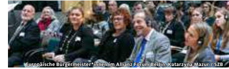
Europäische Bürgermeister*innen im Allianz Forum Berlin