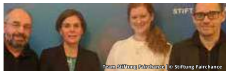
Team Stiftung Fairchance