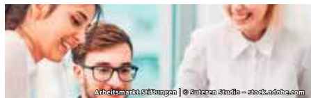
Arbeitsmarkt Stiftungen

BUNDESVERBAND DEUTSCHER STIFTUNGEN ARBEITSMARKT STIFTUNGEN JOBS UND PERSPEKTIVEN IM STIFTUNGSSEKTOR