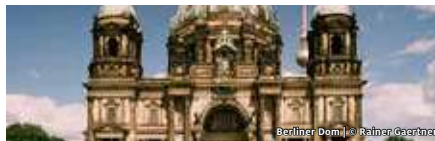
Berliner Dom

BERLINER-DOM-STIFTUNG KIRCHE, KUNST UND KAISER EINE FÜHRUNG DURCH DEN BERLINER DOM