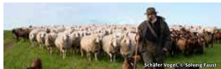
Schäfer Vogel