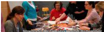
Netzwerktreffen in der Friedensburg, Oberschule