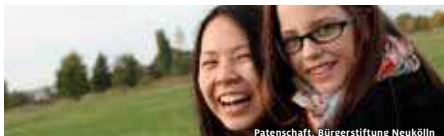
Patenschaft, Bürgerstiftung Neukölln