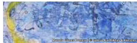
Manolo Gómez Romero

KONTAKT Tobias Götzte | T (05527) 91 44 16 tobias.goetzte@sielmann-stiftung.de