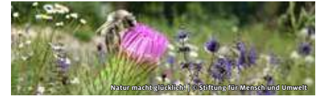
Natur macht glücklich!

STIFTUNG FÜR MENSCH UND UMWELT NISTHILFEN-BAUWORKSHOP MIT NATURGARTENFÜHRUNG IN LÜBARS LEBENSRAÜME FÜR WILDBIENEN & CO.