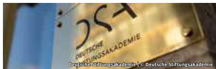
Deutsche Stiftungsakademie