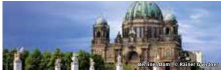
Berliner Dom | © Rainer Gaezner