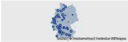
Zahlen | © Bundesverband Deutscher Stiftungen

BUNDESVERBAND DEUTSCHER STIFTUNGEN NETZWERKE, THEMEN, SERVICES ANTWORTEN RUND UM DEN BUNDESVERBAND DEUTSCHER STIFTUNGEN