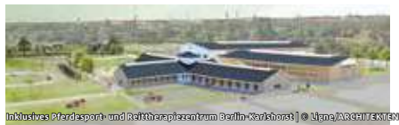
Inklusives Pferdesport- und Reittherapiezentrum Berlin-Karlshorst | © Llyno/ARCHITEXTEM

STIFTUNG REHABILITATIONSZENTRUM BERLIN-OST INKLUSIVES PFERDESPORT- UND REITTHERAPIEZENTRUM MENSCH UND PFERD – THERAPIE UND SPORT