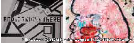
© Inks!stop © Kyle EGRET, rechts: coconut girl © MATSUBARA Katsuhiko