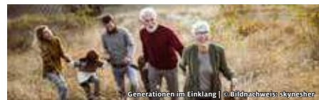
Generationen im Einklang