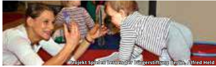
Projekt Spielen Lernen der Bürgerstiftung Berlin, Alfred Held