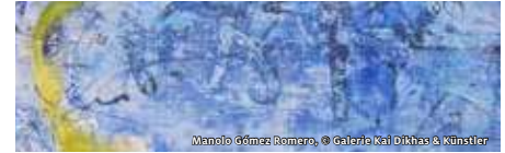
Manolo Gómez Romero, © Galerie Kai Dikhas &amp; Künstler