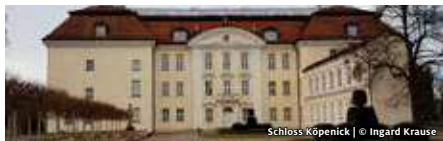
Schloss Köpenick

BÜRGERSTIFTUNG TREPTOW-KÖPENICK SCHLOSS KÖPENICK – KUNSTGEWERBE- MUSEUM AUF DER SCHLOSSINSEL EIN EXKLUSIVER BLICK IN DIE AUSSTELLUNG