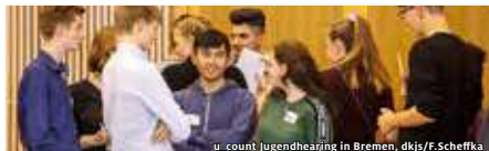
u_count Jugendhearing in Bremen