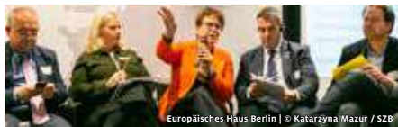
Europäisches Haus Berlin

STIFTUNG ZUKUNFT BERLIN DIE VERANTWORTUNG DER STÄDTE FÜR DAS GELINGEN EUROPAS THE CONFERENCE ON THE FUTURE OF EUROPE