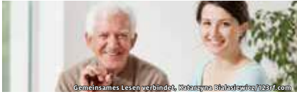
Gemeinsames Lesen verbindet