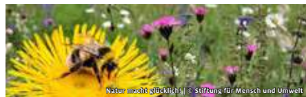
Natur macht glücklich | Stiftung für Mensch und Umwelt