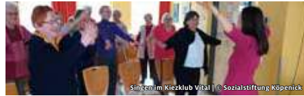
Singen im Kiezklub Vital

SOZIALSTIFTUNG KÖPENICK CHOR FÜR EINEN NACHMITTAG DURCH SINGEN ZUM GLÜCK