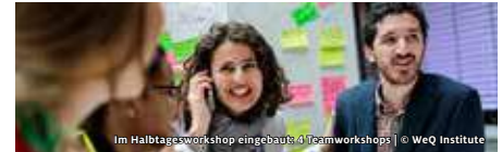
Im Halbtagesworkshop eingebaut: 4 Teamworkshops