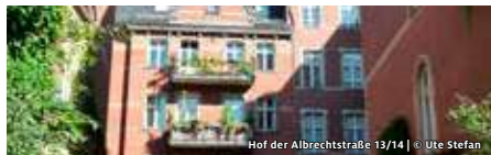
Hof der Albrechtstraße 13/14