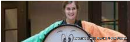
Rapauke macht Musik

STIFTUNG BRANDENBURGER TOR RAPAUKE UND DAS GLÜCK KONZERT UND WERKSTATT FÜR KINDER VON 3 BIS 5 JAHREN