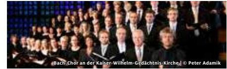
Bach-Chor an der Kaiser-Wilhelm-Gedächtnis-Kirche

STIFTUNG KAISER-WILHELM-GEDÄCHTNISKIRCHE KANTATE-GOTTESDIENST JOHANN SEBASTIAN BACH, KANTATE 31