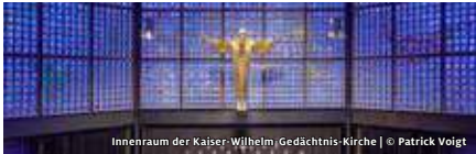
Innenraum der Kaiser-Wilhelm-Gedächtnis-Kirche