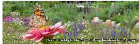
Natur macht glücklich!

KONTAKT Susanne Funk | T (030) 652 11 17 59 stiftung@brot-fuer-die-welt.de