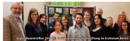
Stipendientreffen 2018

HERAEUS BILDUNGSSTIFTUNG, HELGA BREUNINGER STIFTUNG GLÜCK DURCH SELBSTMANAGEMENT 2-TÄGIGES SEMINAR FÜR LEHRER*INNEN