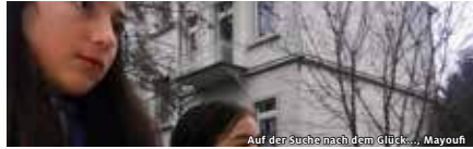
Auf der Suche nach dem Glück..., Mayoufi