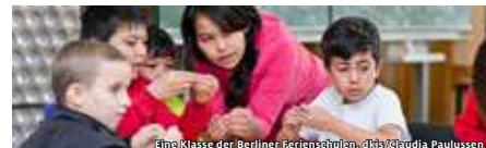
Eine Klasse der Berliner Ferienschulen